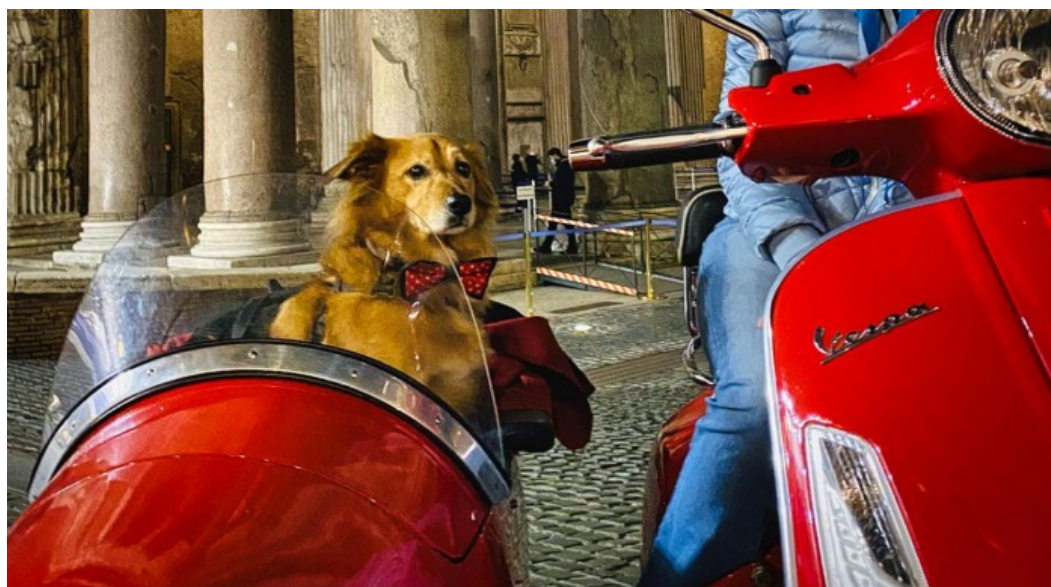
A Roma su una vespa sidecar assieme ad una guida autorizzata, si va a scoprire le meraviglie di Roma.

Pubblicato il 18 Luglio 2021 | By Redazione | In SOCIETÀ , Turismo